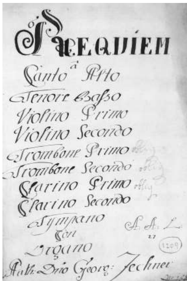
Deckblatt der Abschrift aus dem Zisterzienserstift Sankt Lambrecht